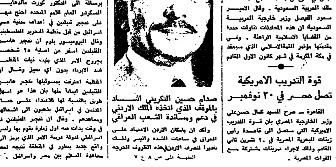
البيعة على ٦٤٨

عمان - اعلن راديو عمان امس ان الملك حسين ملك الاردن وضع جيشه تحت تصرف القيادة العليا للقوات العراقية المسلحة وجاء هذا القرار في اعقاب الزيارة الخاطفة التي قام بها الملك الاردني امس الاول الى العراق . واعلن الملك حسين عن تأييده التام للعراق في حربه ضد ايران ، وقال راديو عمان ان الرئيس العراقي